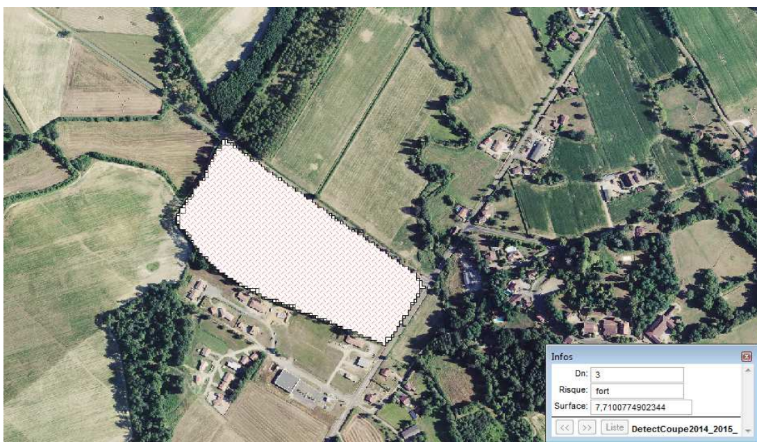
Illustration 1: Coupe de 7,7 ha repérée par télédétection. Dans ce cas, après analyse, il ressort qu'il s'agit d'une peupleraie sur une propriété de moins de 25 hectares, donc la coupe n'était pas soumise à autorisation.

Une fois ces informations récupérées, elles sont croisées avec d'autres données afin de repérer les coupes qui auraient dû faire l'objet de demandes d'autorisation. En complément, des visites sur place réalisées par un agent assermenté permettent de constater concrètement les faits et de dresser le cas échéant un procès verbal.